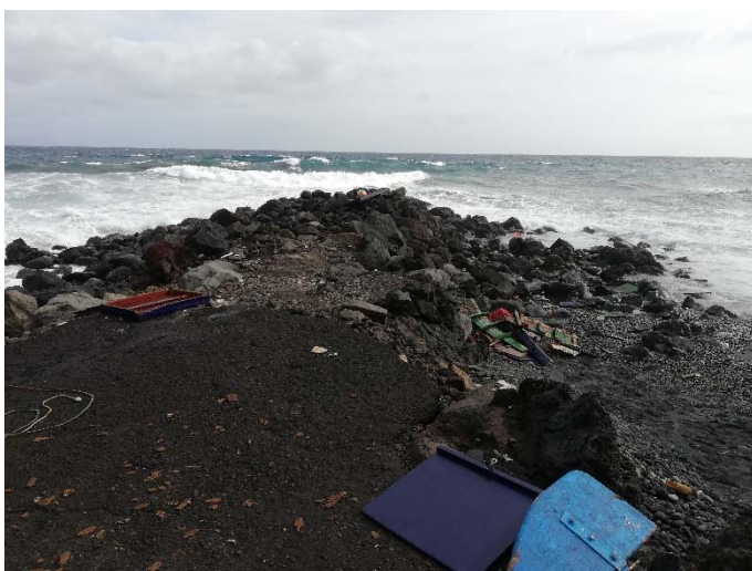
Figura 5. Restos E/P JOSE RAMON

A las 07:25 horas, la E/S SALVAMAR TENERIFE llegó a la zona del accidente. Informaron que el casco se encontraba destrozado sobre las rocas y que no observaban restos de contaminación en la zona.