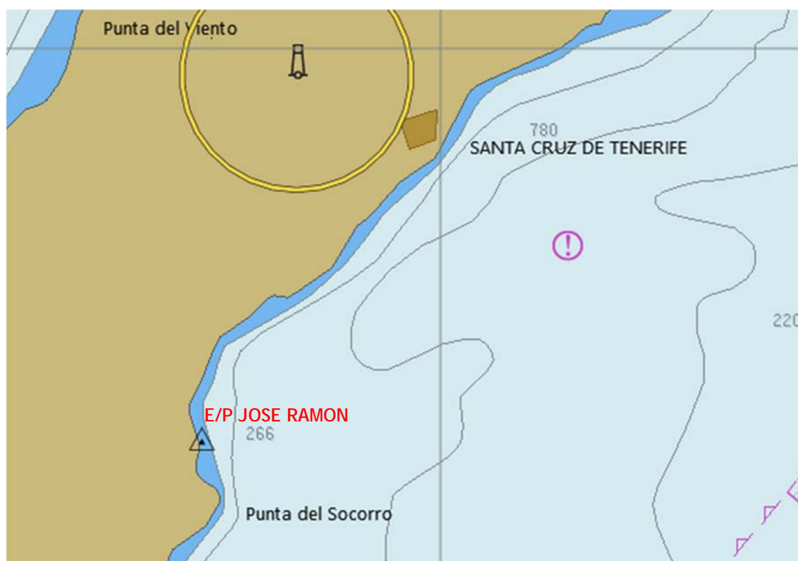
Figura 3. Zona del accidente

El relato de los acontecimientos se ha realizado a partir de los datos, declaraciones e informes disponibles. Las horas referidas son locales.