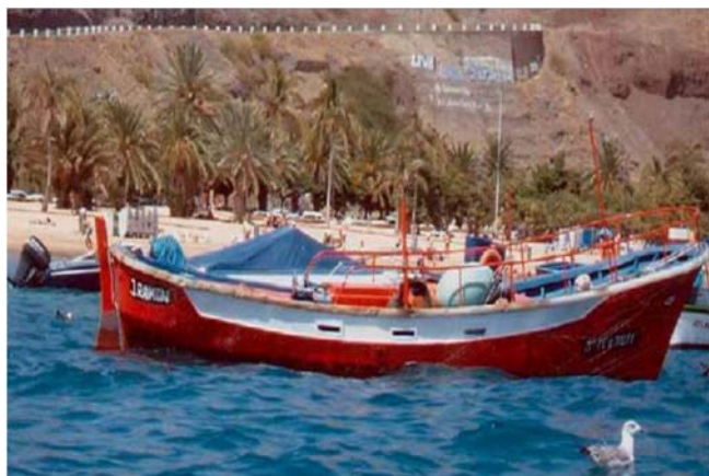
Figura 1. E/P 1 JOSE RAMON