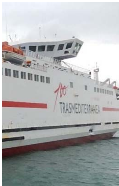
Figura 7. Buque CIUDAD DE MALAGA.

Según el informe realizado por la inspección de la Capitanía Marítima de Algeciras, el buque presentaba una grieta en el costado de estribor de alrededor de unos 3x1 m a una altura de 2 m sobre la línea de máxima carga que afectaba a los siguientes espacios: