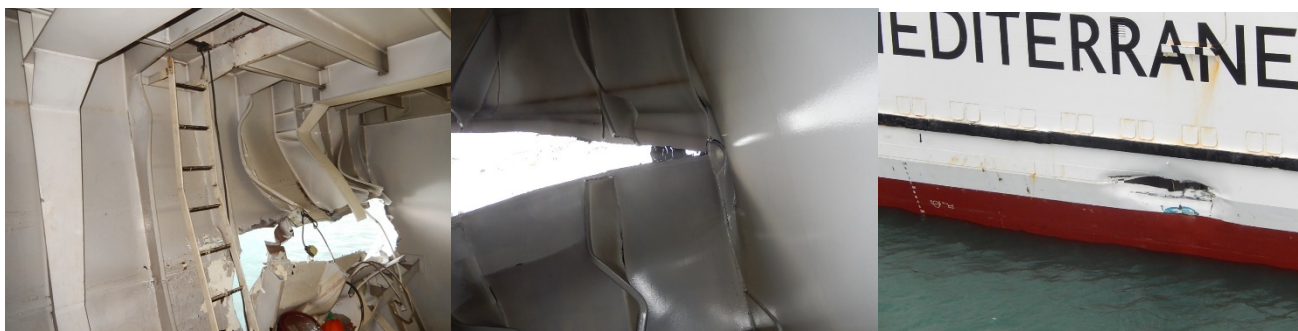
Figura 8. Daños en el buque CIUDAD DE MALAGA

Como consecuencia de lo anterior la Capitanía Marítima de Algeciras consensuó con la compañía armadora que el buque se dirigiese a un astillero para su reparación, emitiéndose la consiguiente condición de bandera en sus Certificados de Navegabilidad y de Seguridad de Buque de Pasaje.