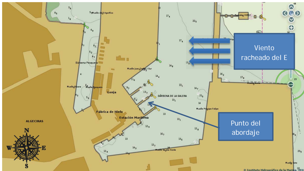
Figura 4. Zona del abordaje en el Puerto de Algeciras

El relato de los acontecimientos se ha realizado a partir de los datos, declaraciones e informes disponibles. Las horas referidas son locales.