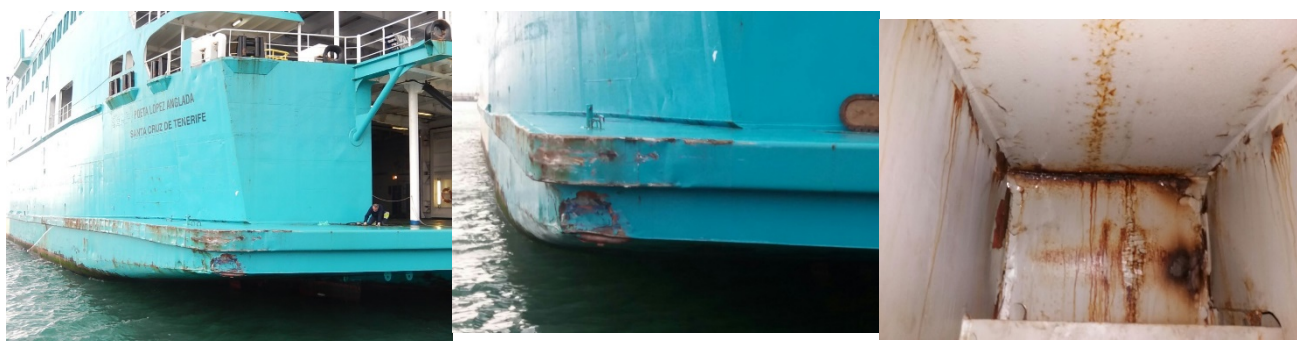
Figura 5. Daños en el buque POETA LOPEZ ANGLADA

Al cabo de unos minutos, el práctico informó al capitán del POETA LOPEZ ANGLADA de que el buque NOVA STAR había desistido de la maniobra de atraque debido a que el viento reinante era fuerte y racheado, y de que la retomaría posteriormente con un práctico y un remolcador.