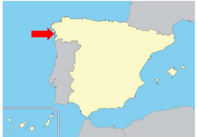
Figura 2. Lugar del accidente