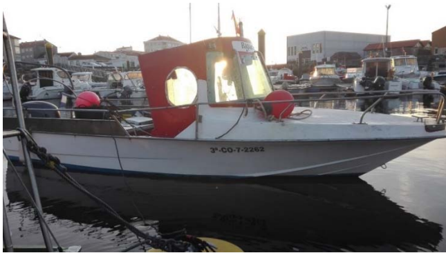
Figura 1. Embarcación RAPACIÑA