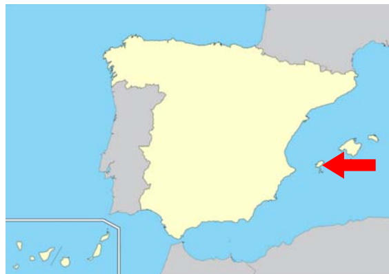
Figura 2. Zona del accidente