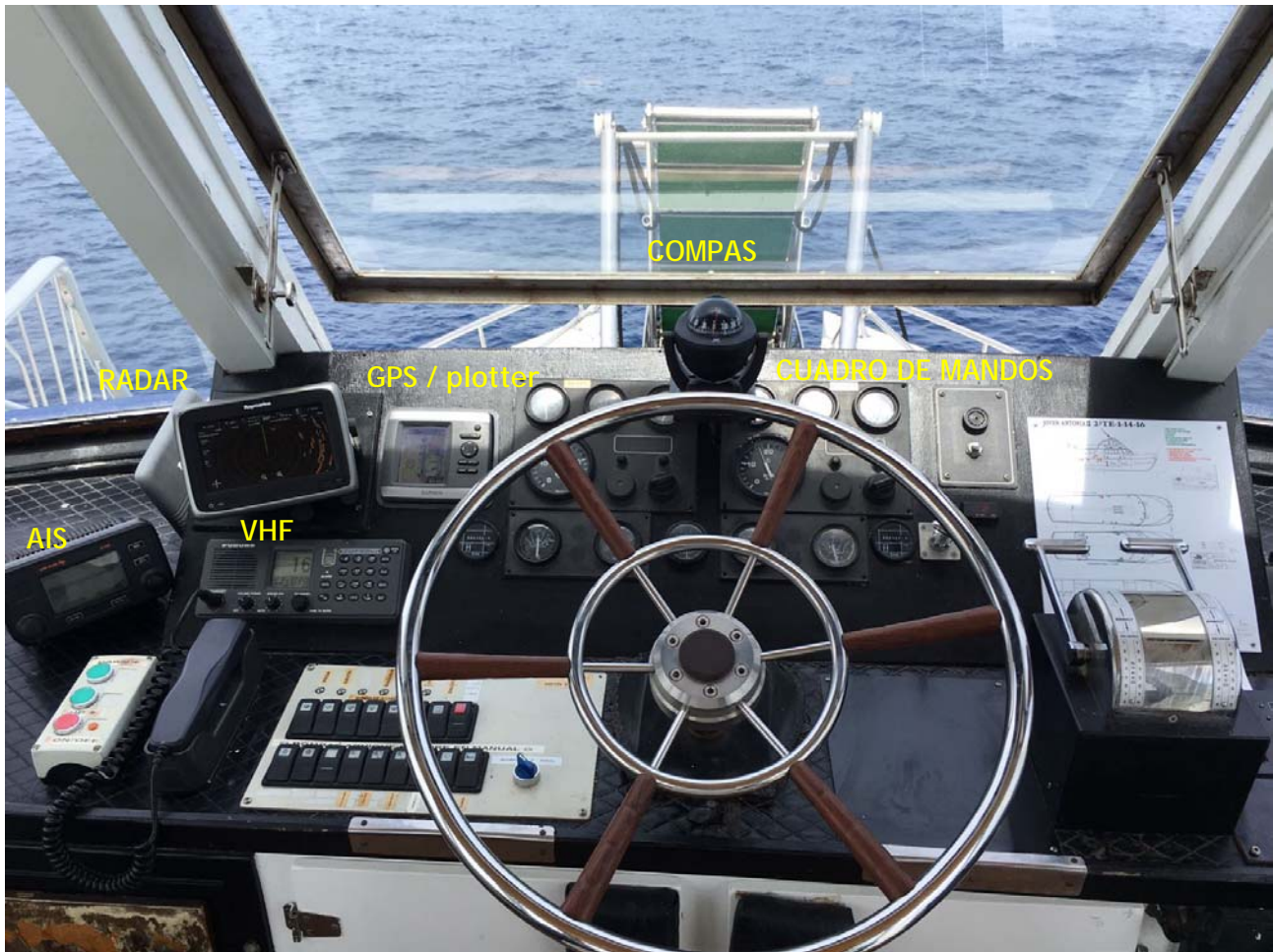
Figura 6. Puente de la E/P JOVEN ANTONIA SEGUNDO y disposición de los equipos tras la modificación a que se refiere el apartado 4.2