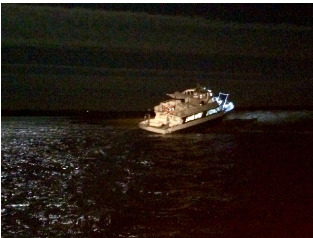
Figura 4. B/P JOVEN ANTONIA SEGUNDO embarrancado

A las 21:26 horas la E/P JOVEN ANTONIA SEGUNDO, informó al CCR 4 Ibiza del accidente y que tanto pasajeros como tripulantes se encontraban en perfecto estado. Los pasajeros iban a ser trasladados por la E/P REGINA ONCE propiedad de la misma empresa al puerto de La Savina.