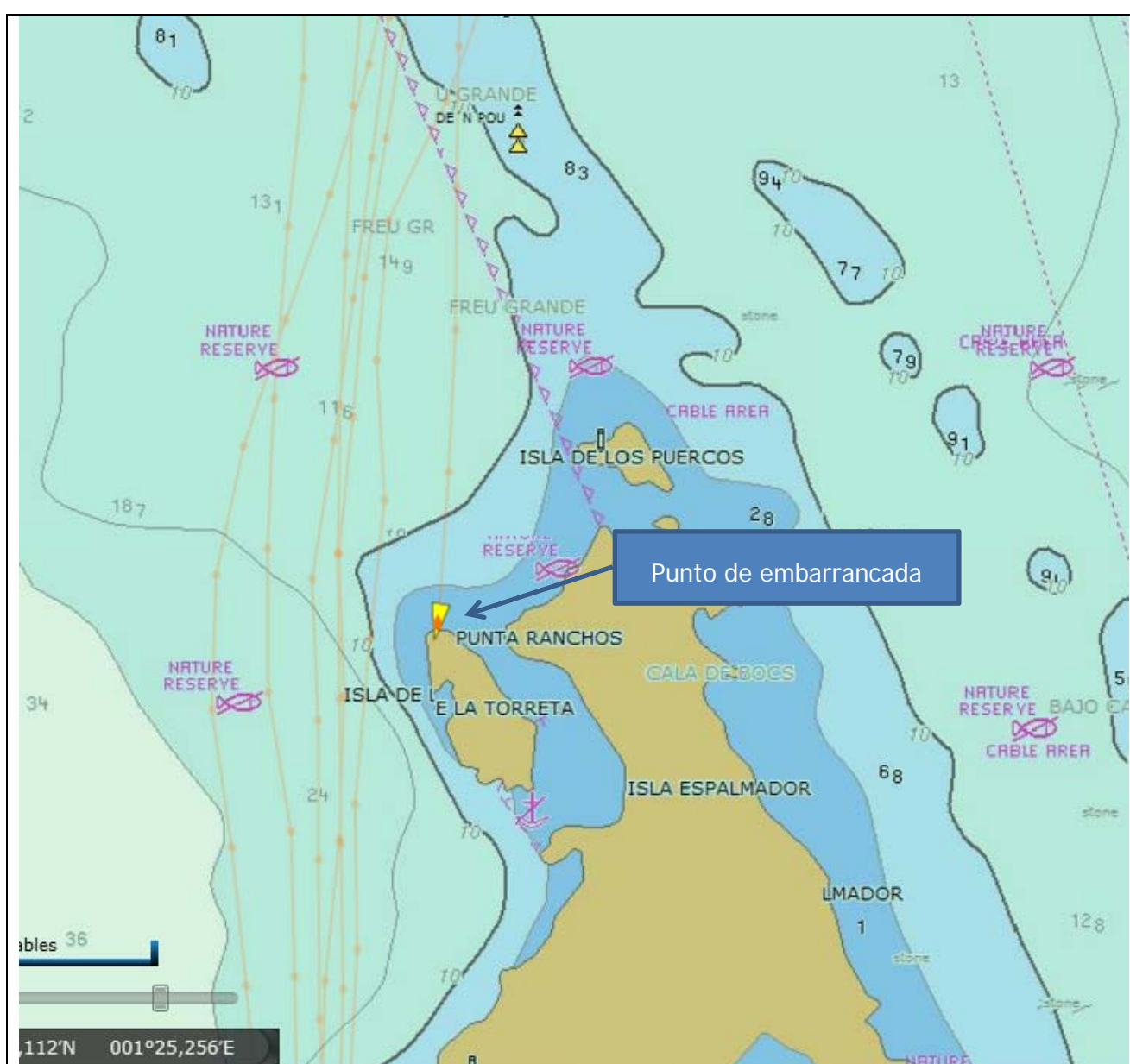
Figura 5. Lugar del accidente y trayectorias seguidas por la embarcación en los distintos viajes a lo largo del día.

El patrón realizaba el trayecto entre Ibiza y Formentera 4 veces al día (ver figura 5), hecho que pudo haber generado un exceso de confianza, que desencadenó en que no verificase la posición por medio de las ayudas electrónicas. El día del accidente el sol se puso a las 20:00 horas, la luna estaba en fase creciente, teniendo una iluminación del 98,7%, por lo que a las 21:08 cuando se produjo la embarrancada, aunque era de noche la luna iluminaba el recorrido. Este hecho pudo haber influido en que se realizara una navegación puramente visual.