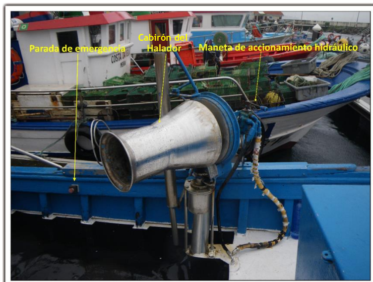
Figura 4. Halador hidráulico