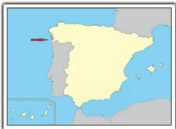
Figura 1. Localización del accidente

El relato de los acontecimientos se ha elaborado a partir de las declaraciones de los testigos y de otros documentos. Las horas referidas a lo largo del informe son locales.